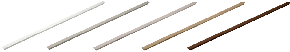
MAN14 Maniglione in legno, dimensioni: lunghezza 95,8 sp 3 cm. Passo 448 mm.