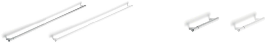
MAN28 Maniglione in metallo, dimensioni: lunghezza 94,4 sp 1.4 cm. Passo 896 mm.